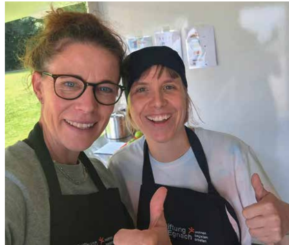
Imbisswagen-Team im Einsatz

Rückblickend war das Imbissprojekt ein voller Erfolg. Es bot nicht nur eine praktische Dienstleistung für die Öffentlichkeit, sondern auch einen wertvollen Rahmen für gemeinsames Arbeiten und gelebte Teilhabe im Alltag. Für mich persönlich war es eine bereichernde Erfahrung, die meine fachlichen und sozialen Kompetenzen gestärkt hat und gezeigt hat, wie viel Potenzial in gemeinsamen, kreativen Ideen steckt.